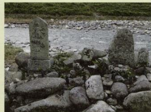
42 地蔵群 (左) 41 庚申碑 (右)