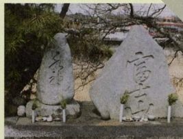
37 西部の水神さん 水神さんと富士山参りの石神さんです。