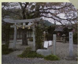
45 照皇宮神明社 伊勢神宮のご神体がまつられています。