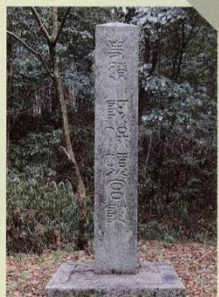
39 阿保頓宮跡 天皇や皇族が旅行されるとききのきき